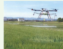
【例】スマート農業機器の活用