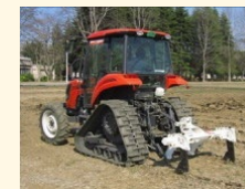
【例】排水対策（明渠、暗渠）