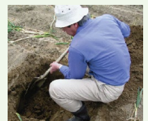
土壌診断に基づく施肥