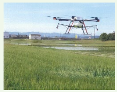
【例】スマート農業機器の活用