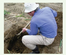
土壌診断に基づく施肥